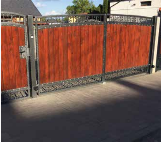
NR: A 005