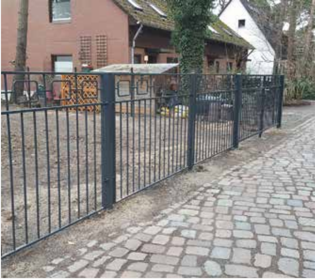
NR: B 009