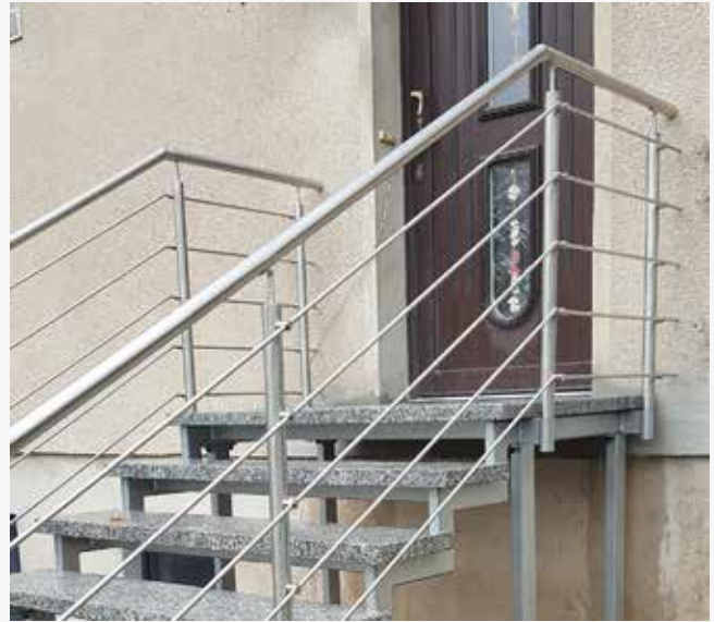
NR: D 002