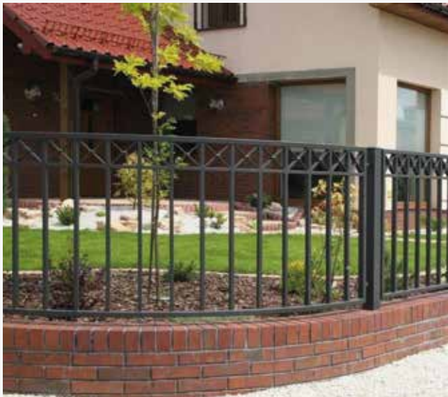
NR: B 003