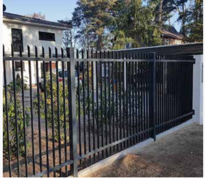
NR: B 006