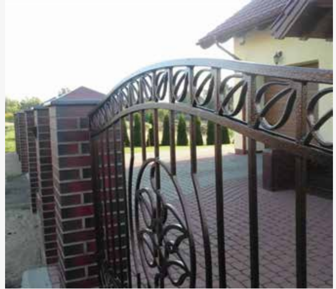
NR: B 002