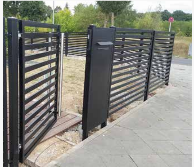
NR: B 012