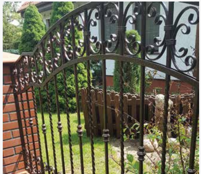
NR: B 008