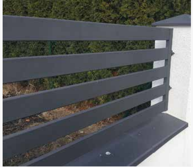
NR: B 010