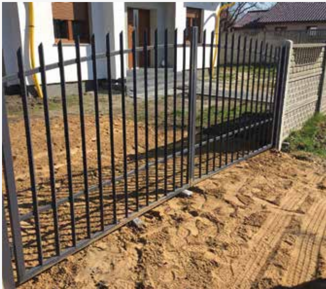
NR: A 007