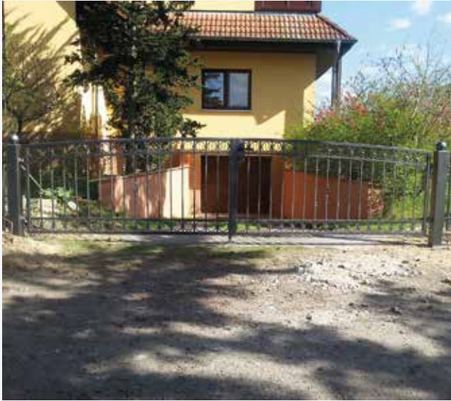
NR: A 001