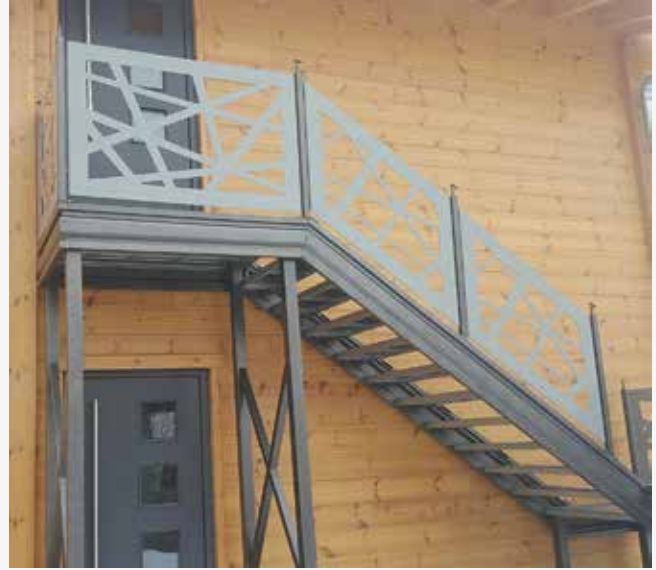
NR: C 002