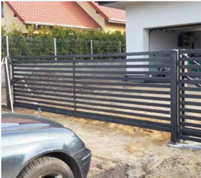
NR: A 011