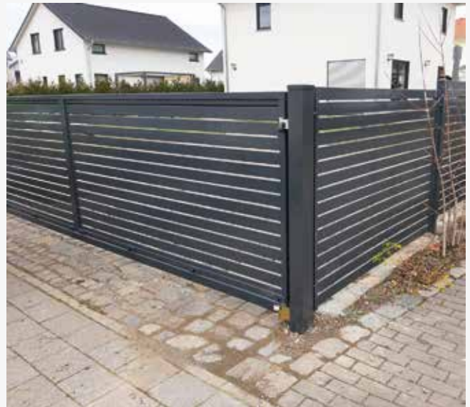
NR: A 008