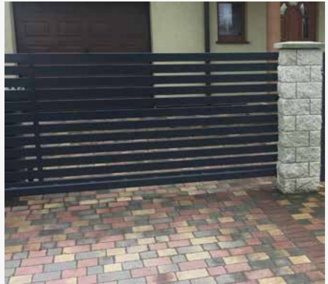
NR: A 012