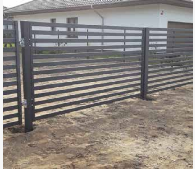
NR: A 006