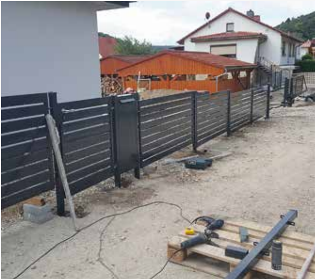
NR: B 011