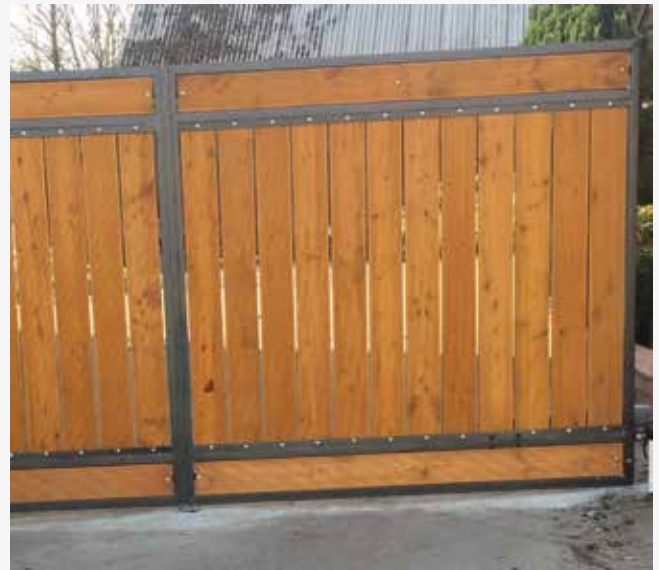
NR: A 004