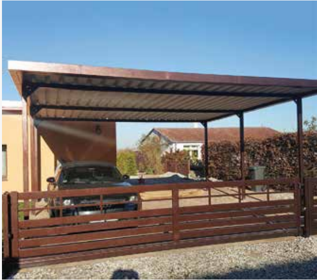
NR: A 009