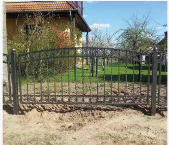
NR: B 004