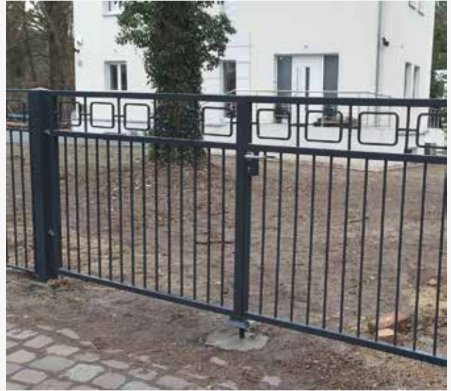
NR: A 010