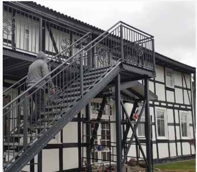
NR: C 004