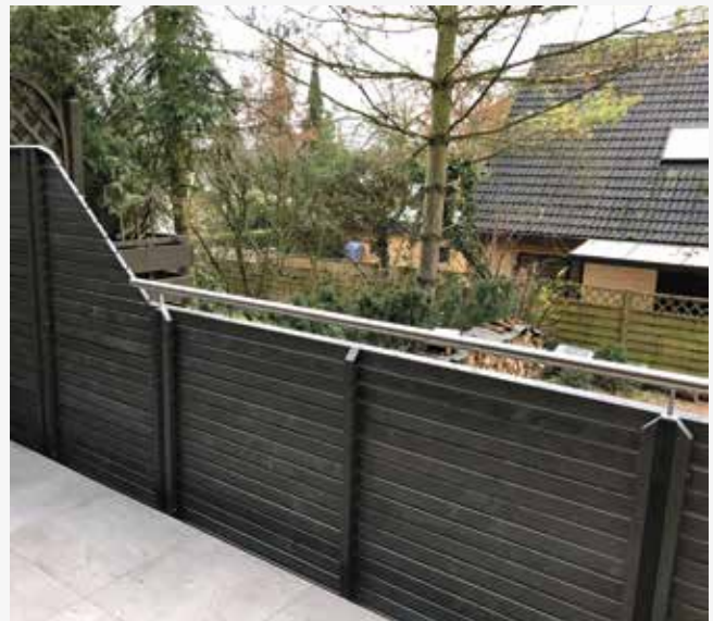
NR: D 004