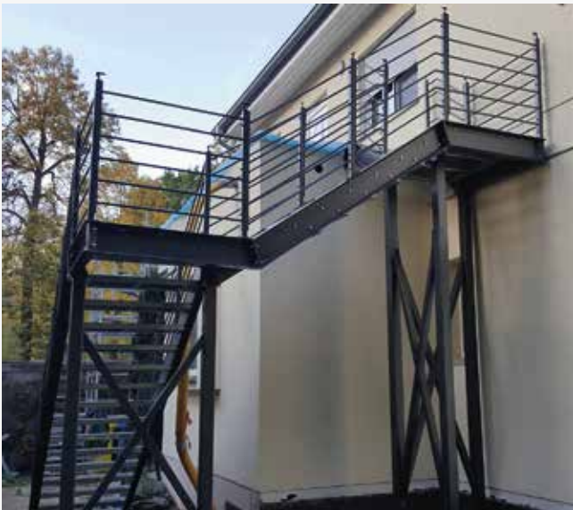
NR: C 003