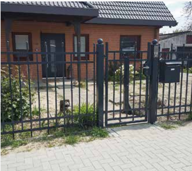
NR: B 007