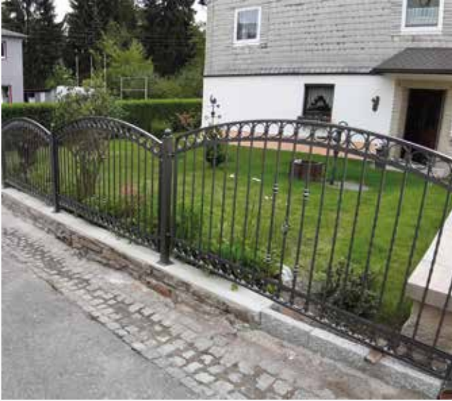
NR: B 005