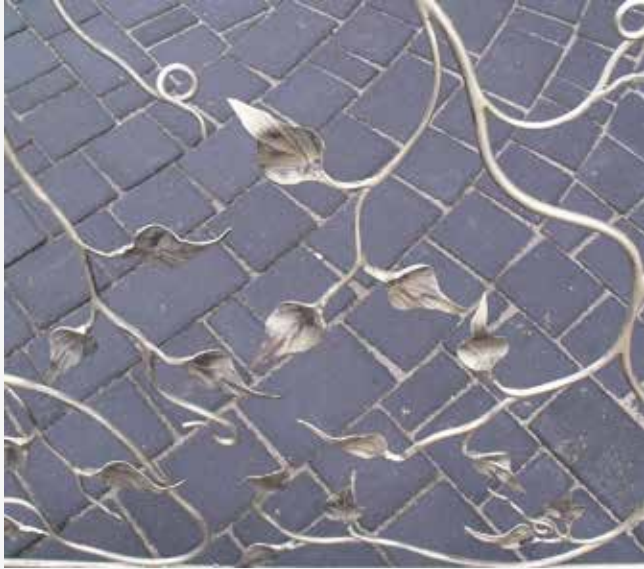
NR: B 001