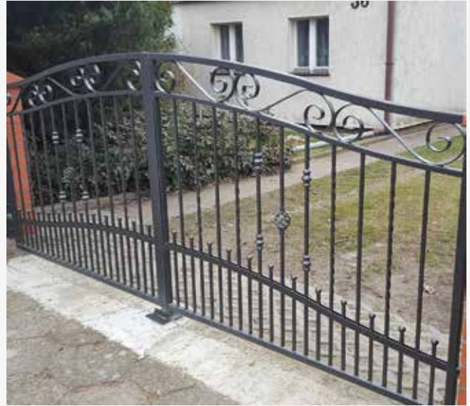
NR: A 002