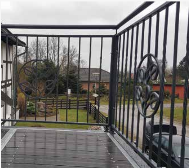
NR: D 003