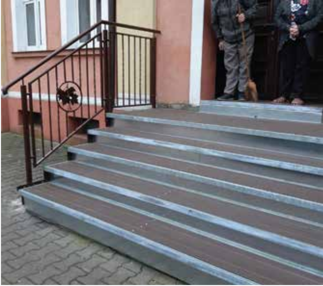
NR: C 001