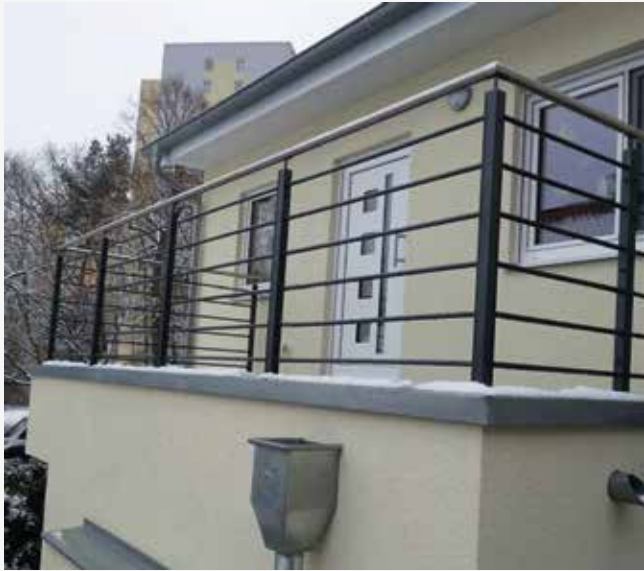
NR: D 001