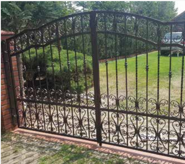
NR: A 003